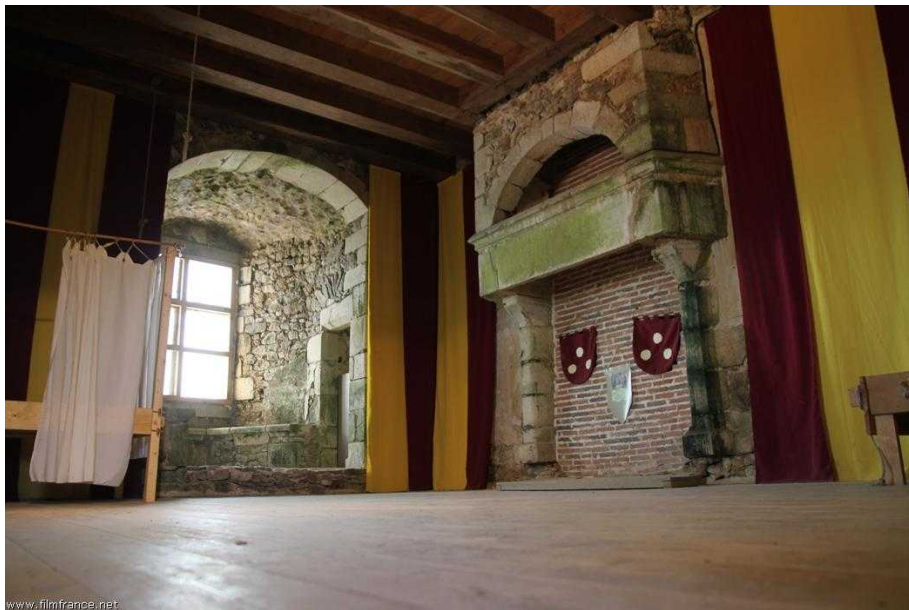
chambre du donjon