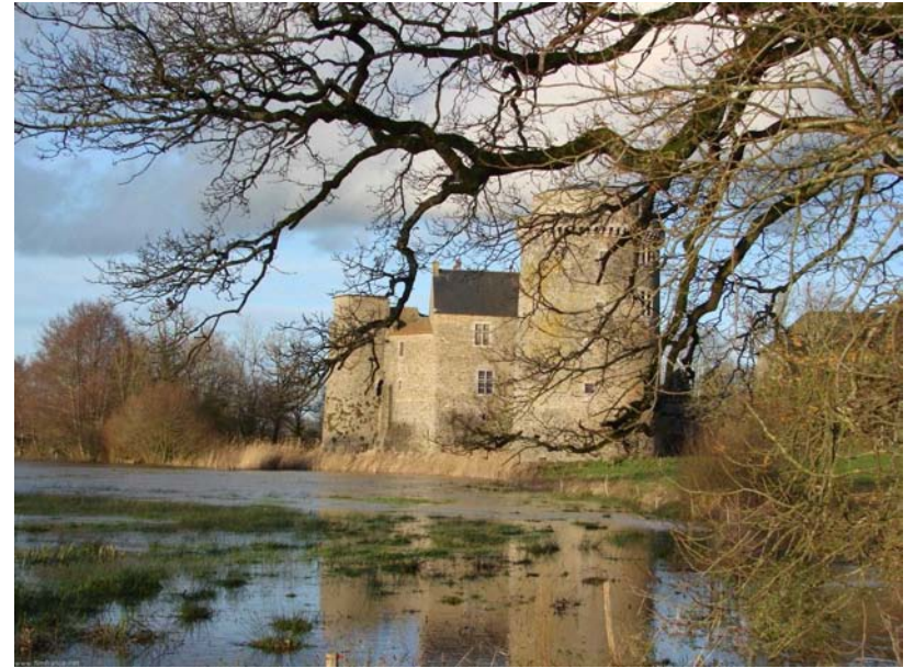
façade Sud