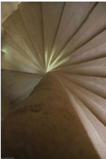
escalier du donjon