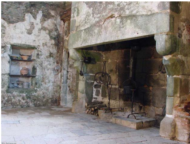
cuisine - © Propriétaire