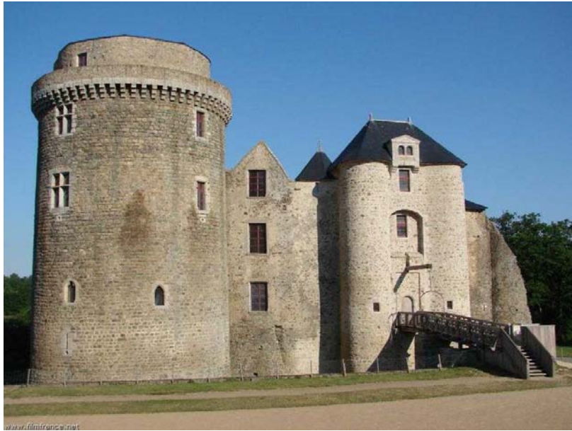
façade Est