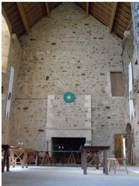
logis - © Propriétaire