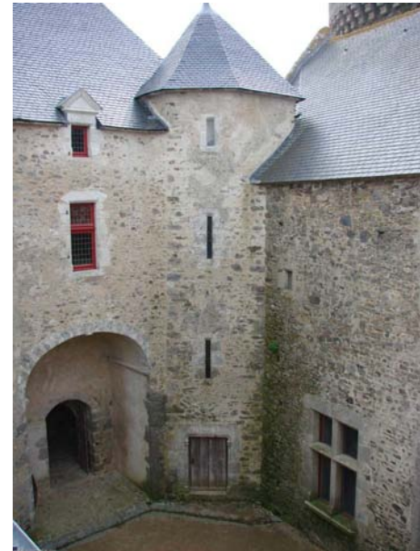
haute cour