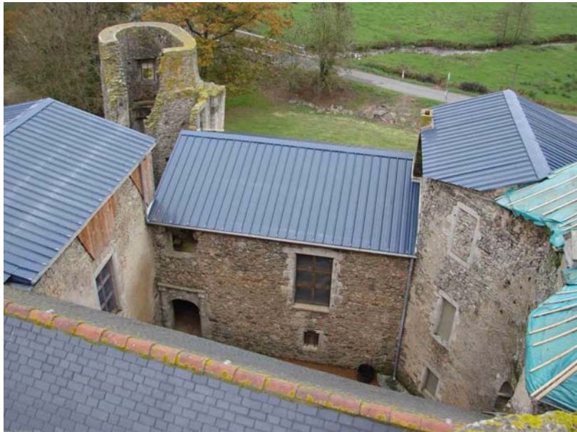
haute cour - © Propriétaire