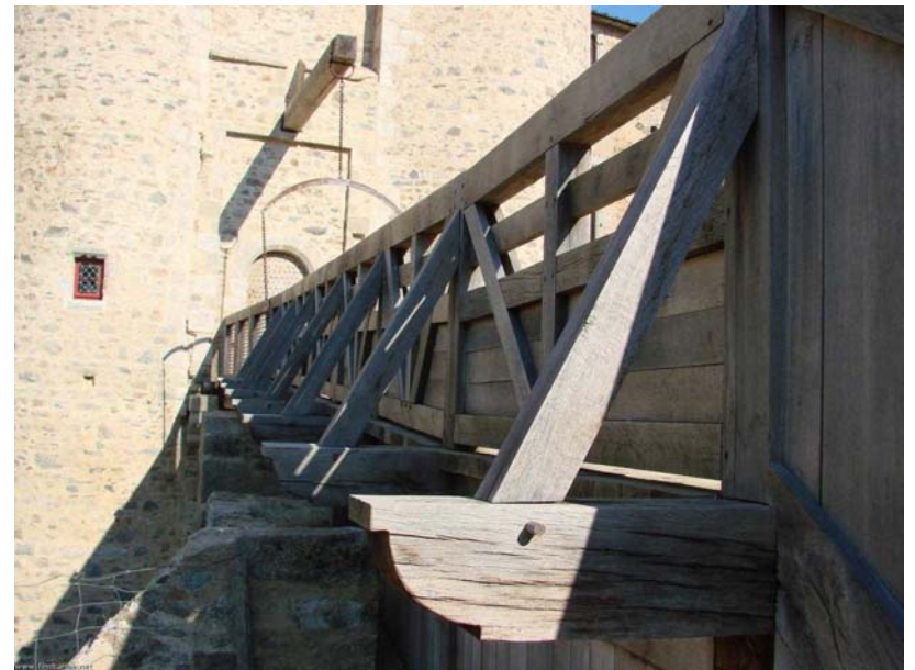
pont levis