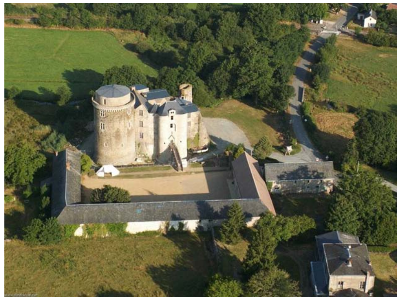
vue aérienne